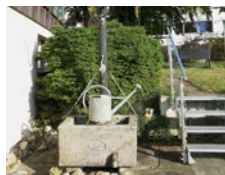
November Pumpbrunnen an der Bergstrasse