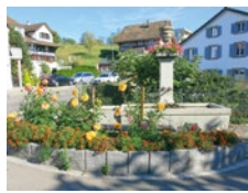
Oktober Brunnen im Dorf