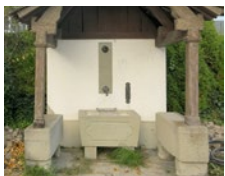
Mai Brunnenhaus am Haslibach