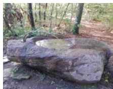
August Natursteinbrunnen aus einem Findling