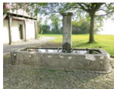
April Hofbrunnen beim Ritterhaus