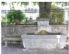
September Sandsteinbrunnen Höfliweg/Rainstrasse