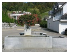
Juni Laufbrunnen in der Binz