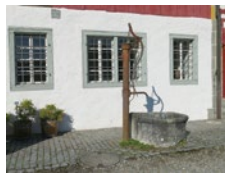
Februar Pumpbrunnen vor Museum «Zur Farb»