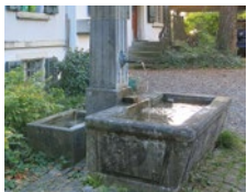
Januar Sandsteinbrunnen «Oberer Steg»