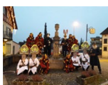
Dezember Sandsteinbrunnen bei der Grundhalde